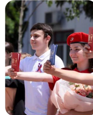
«МЫ – ГРАЖДАНЕ РОССИИ!»