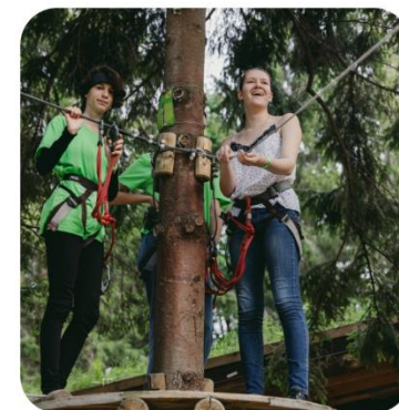
«ПОХОДЫ ПЕРВЫХ- БОЛЬШЕ, ЧЕМ ПУТЕШЕСТВИЕ»